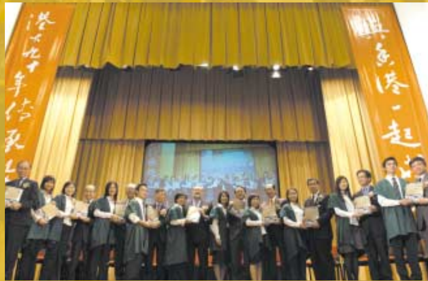
For details and programmes of the 90th Anniversary Celebrations, please visit www.hku.hk/hku90 .

A 20% discount on the book is offered to HKU staff and alumni at the Alumni Office, 9/F, Knowles Building, HKU (Enquiries: 852-28578584). For details, please visit our website at www.hku.hk/alumni/profile .